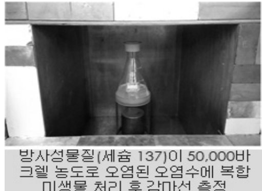
방사성물질(세슘 137)이 50,000바크렐 농도로 오염된 오염수에 복합 미생물 처리 후 감마선 측정