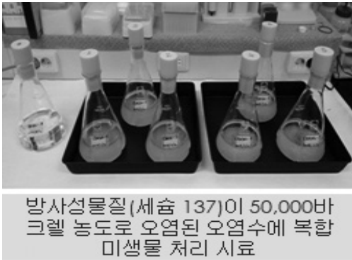
방사성물질(세슘 137)이 50,000바크렐 농도로 오염된 오염수에 복합 미생물 처리 시료